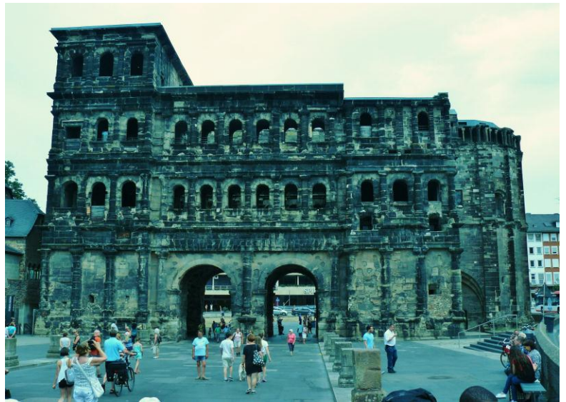
La Porta Nigra

Nous avons clôturé notre belle semaine mosellane par la visite de la ville de Trèves et de ses trésors architecturaux datant de l'époque romaine